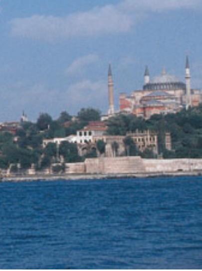
Veduta di Istanbul. A Nicea nella Chiesa del 7° Concilio, presenti focolarine e focolarini di Istanbul (a lato).