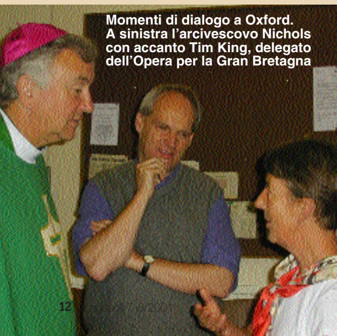
Momenti di dialogo a Oxford. A sinistra l'arcivescovo Nichols con accanto Tim King, delegato dell'Opera per la Gran Bretagna

Nell'ultima settimana di luglio, nella città universitaria di Oxford, il Centro per lo studio della Fede e della Cultura ha promosso una Scuola estiva intitolata «La missione dei battezzati», aperta al contributo dei Movimenti.