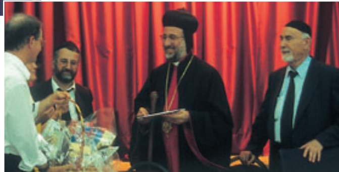
Scambio di doni con il Metropolita Yusuf Çetin

che sono ogni volta un'autentica promessa della piena comunione fra i cristiani: col Patriarca degli Armeni apostolici in Istanbul e in tutta la Turchia, Mesrob Mutafyan, all'isola di Kinali, e col Metropolita dei siro-ortodossi, Yusuf Çetin.