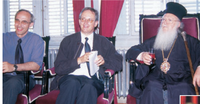
Con il Patriarca Bartolomeo

questo giorno grande e glorioso verrà». Dopo il festoso pranzo, nel pomeriggio il Patriarca torna tra i gens per la celebrazione dei Vespri. E poi li saluta: